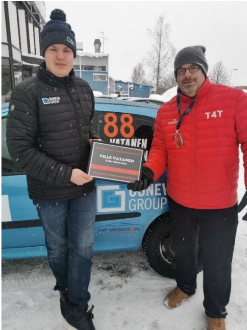
Villelle ojennetaan Rally Talent -diplomi 5.2.2022.