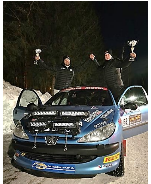
SM-Ralli Kuopio, luokkavoitto 5.3.2022.