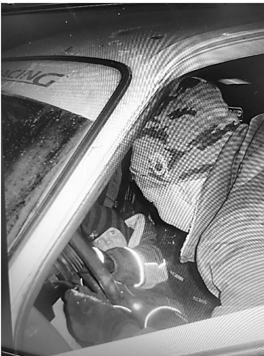
Ville 2-vuotiaana isän ralliautossa.