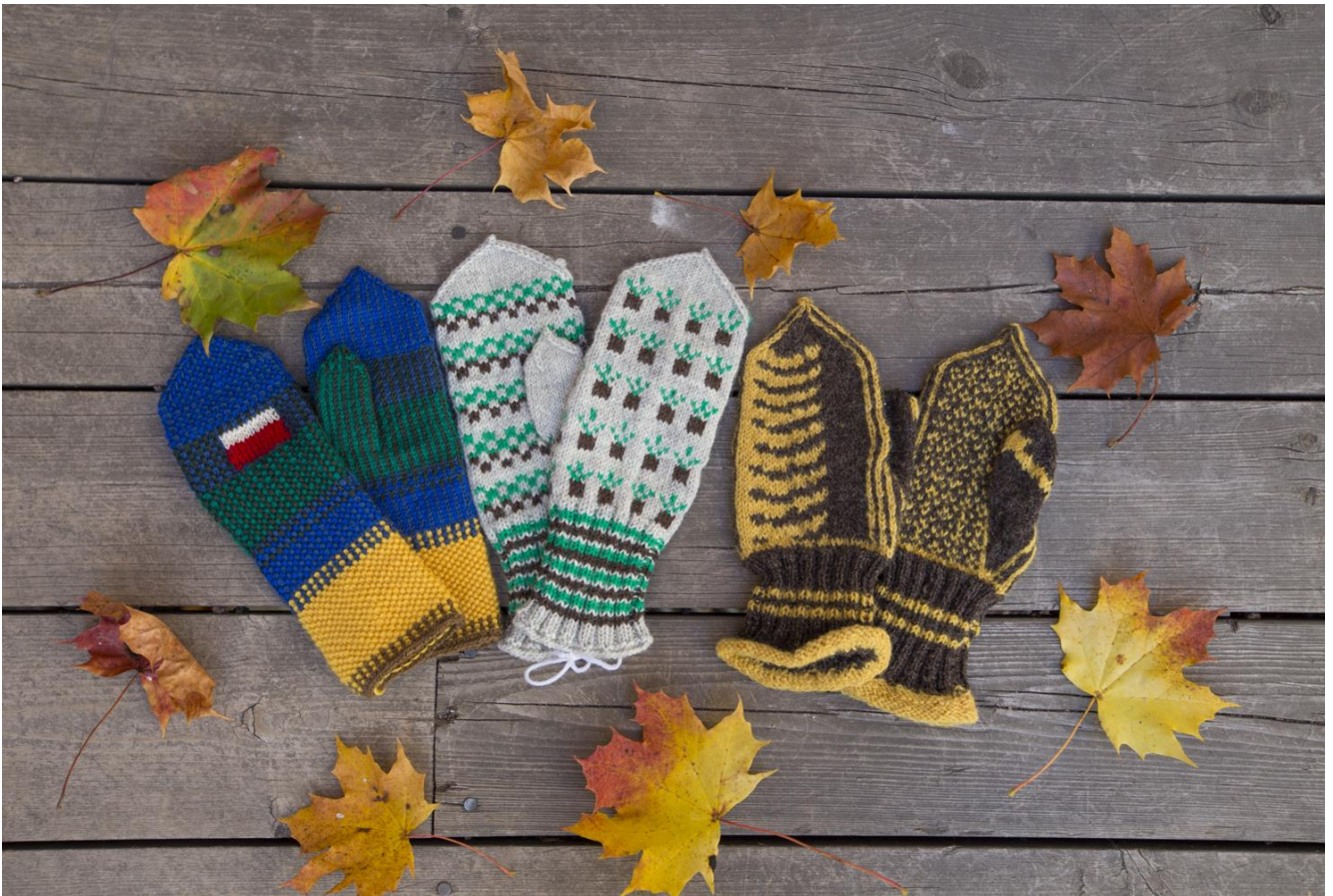
Kuvassa vasemmalla voittaja, Vatas-kintaat. Keskellä Jännti-suvun lapaset ja oikealla Nyyssösten lapaset.