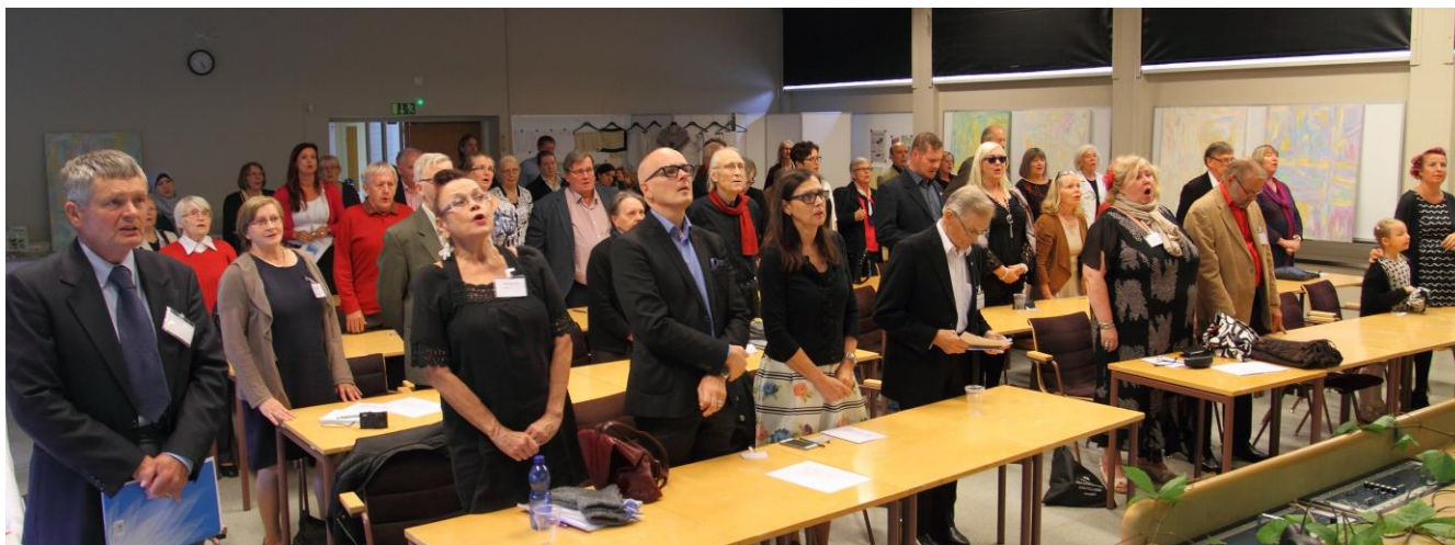
Ei oo meillä rikkautta eikä maamme viljavaa, vaan on laulun runsautta, kylvämättä kasvavaa...