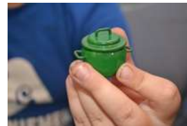
Vaimon lapsuudenmökkin pienoismallin kattila.