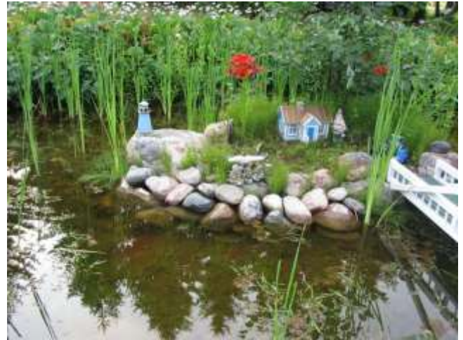
Puutarhurin ja rakentajan pihassa on paljon katseltavaa.