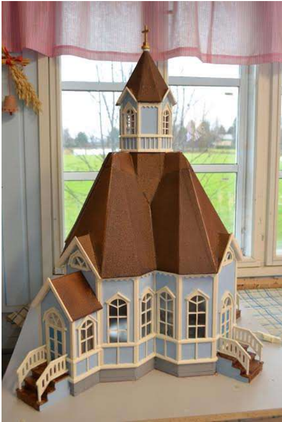
Kirkko on suhteellisen tarkka kopio Piippolan Magdalenan kirkosta.

...jatkoa Piippolan vaarin taloihin sivulta 10.