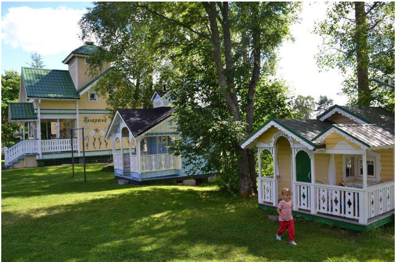
Kesäpäivä, Päiväuni ja Kevätaamu toimivat lasten perheiden leikkien näyttämönä.