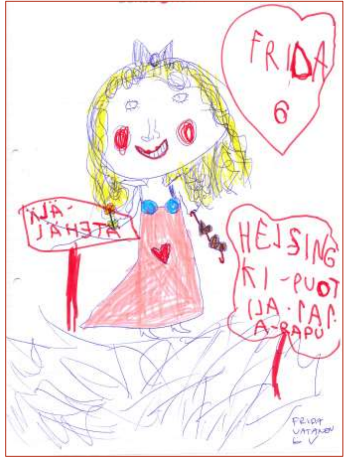
Frida Vatanen (6 vuotta), Helsinki