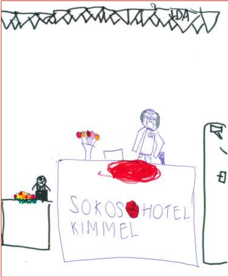
Ida Turunen (6 vuotta), Helsinki "Veijo Saloheimo esitelmöi"