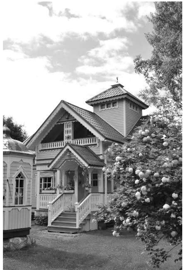
Ensimmäinen karjalaiskoristeinen rakennus sai nimekseen Kesäpäivä. Sen edustalla Kaivohuone.

Rakennus nimettiin Kesäpäiväksi ja sen seinien suojissa onkin ikuinen kesä värivalintojen ansiosta.